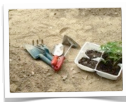
é ora di riporli in serra