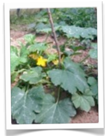
...e alla fine...