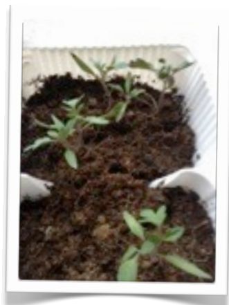
I germogli attecchiscono