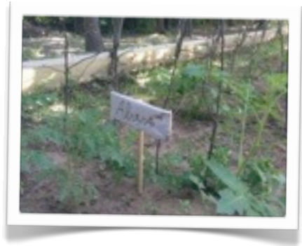
ecco come crescono....