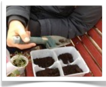
Trapiantiamo i germogli