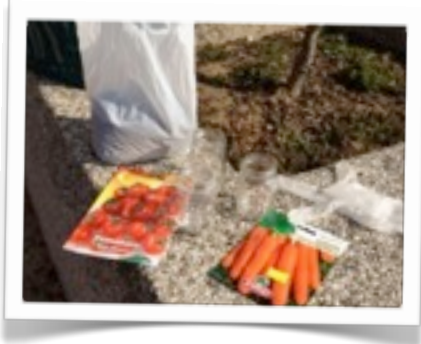
Il momento della semina